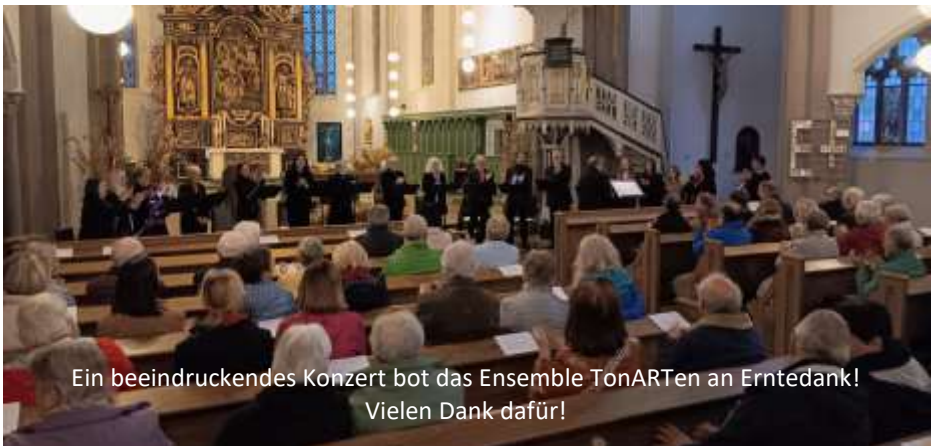
Ein beeindruckendes Konzert bot das Ensemble TonARTen an Erntedank! Vielen Dank dafür!

Diese und alle weiteren Konzertermine des Jahres finden sich in den Programmflyern, die in den Kirchen ausliegen und natürlich auch auf der Homepage der Kirchengemeinde unter Kirchenmusik.